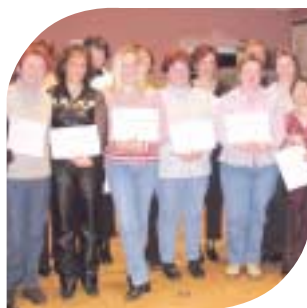
Remise des diplômes A.F.P.S. aux assistantes maternelles par le Président André ONIMUS