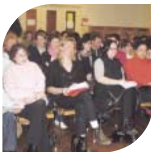
Soirée d'information sur l'application de la nouvelle convention collective des assistantes maternelles