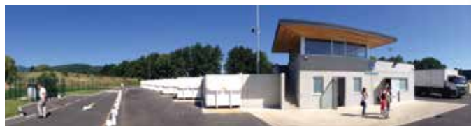
Déchèterie de Soultz

Ils se sont réunis à plusieurs reprises afin de faire l'état des lieux du service et donner leur avis sur ce projet, validé par le conseil communautaire, de manière unanime, le 29 septembre 2014.